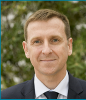
LE MOT DE PHILIPPE COURT, PRÉFET DU VAL-D'OISE

Pour accélérer vos projets de transition écologique